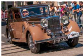
Daimler Vanden Plas primée au concours d'état.