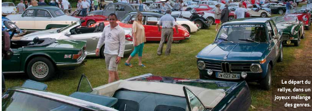
Le départ du rallye, dans un joyeux mélange des genres.

Les 27 et 28 juin a eu lieu la quinzième édition de la commémoration du Grand Prix de Tours 1923. Comme le veut la tradition, elle a commencé par un rallye de plus de 180 voitures extrêmement diverses, mêlant Citroën 2 CV de 1958 et Delahaye 135, AC Cobra et Bentley 4,5 litres à compresseur, Daimler SP 250 et Lorraine-Dietrich A4. Le tracé de 180 km empruntait les routes de la vallée de la Loire en s'arrêtant aux châteaux de Planchoury (qui abrite la collection Cadillac de la famille Keyaerts), d'Artigny pour le repas, de Beaulieu et de Luynes.